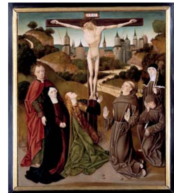
Kruisdood van Christus met stigmatisatie van Franciscus, Noord-Nederland, eind 15e eeuw

De belangrijkste bedelorden zijn de dominicanen en de franciscanen. De orde van de dominicanen of predikerheren wordt in 1216 gesticht door de Spaanse kanunnik Dominicus Guzman (1170-1221). De orde houdt zich vooral bezig met godsdienstonderwijs en het prediken, verkondigen, van het christelijk geloof.