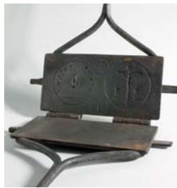
Hostieijzer, Nederland, 18e eeuw Vanaf de Middeleeuwen gebruiken kloosterlingen hostieijzers om hosties* te bakken voor de mis*.