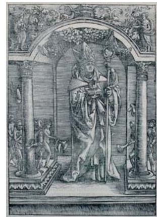
Benedictus, Missale ordinis sancti Benedicti, Thomas Anshelm Badensis, 1518

Pachomius tot een nieuwe. Volgens hem is het kloosterleven een afwisseling van bidden, studeren én werken: 'Nietsdoen is een vijand van de ziel.' Bovendien moeten de kloosterlingen bij hun intrede in het klooster drie belangrijke geloften afleggen. Op deze manier tonen zij hun nederigheid aan God. De eerste belofte is die van armoede. Kloosterlingen doen afstand van al hun persoonlijke bezittingen. Ten tweede is gehoorzaamheid aan het hoofd van het klooster vereist. De laatste gelofte betreft kuisheid. Sex is niet toegestaan in de kloosterwereld. Kloosterlingen die leven volgens de regel van Benedictus worden benedictijnen of benedictinessen genoemd.