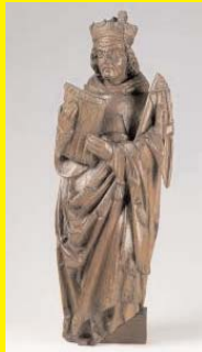
Abt, Noord-Nederland, laatste kwart 15e eeuw