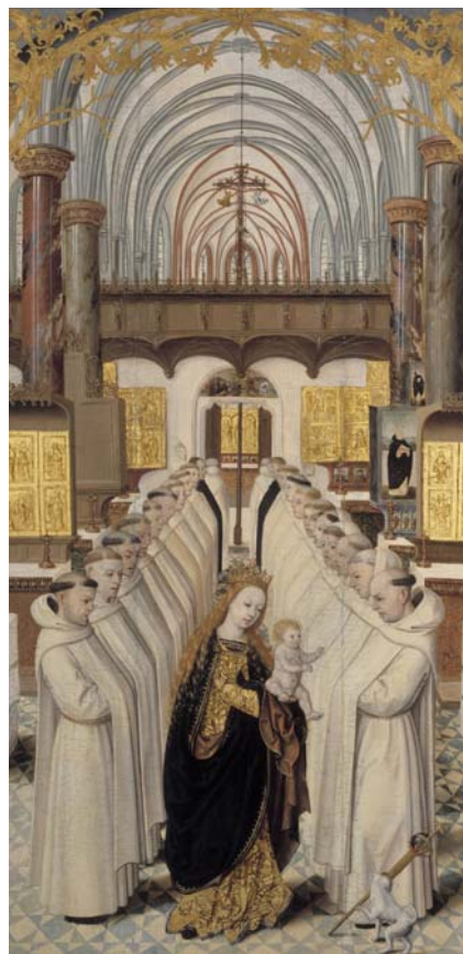
Verschiing van Maria met kind aan Dominicus, Noord-Nederland, begin 16e eeuw Dit schilderij geeft een goede indruk van het interieur van een middeleeuwse kerk. In de zijkapellen zijn verschillende altaren afgebeeld.

Wist je dat... ... Benedictus voorschrijft dat monniken in bed hun kleren en riem dragen?