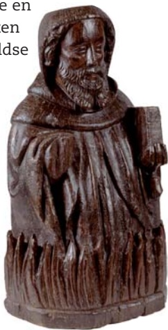
Antonius abt, Noord-Nederland, ca. 1450

Omstreeks 300 keert een aantal kluisenaars in Egypte en het Midden-Oosten zich af van wereldse en materiële zaken. Een van de eerste christenen die zich terugtrekt, is Antonius (251-356). In de eenzaamheid van de Egyptische woestijn wijdt deze monnik zijn leven aan gebed en aan meditatie over God.