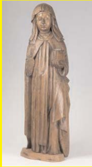
Abdis, Zuid-Nederland?, Noord-Brabant?, eind 15e eeuw