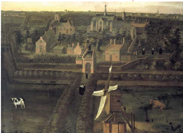
Noord-Nederland, Abdij van Leeuwenhorst, 1e kwart 18e eeuw In 1261 stichten Aarnout en Waalwijn van Alkmade bij Noordwijkerhout de abdij van Leeuwenhorst, bewoond door cisterciënzerinnen. We weten niet zeker of de abdij er ook werkelijk zo uitzag.