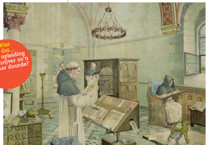
In een middeleeuws klooster, J.H. Isings, ca. 1920

Wist je dat... ... de opleiding tot schrijver zo'n zes jaar duurde?