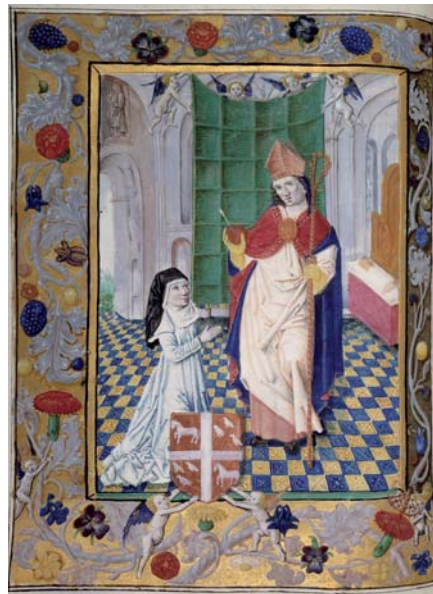
Brevier van Beatrijs van Assendelft, Delft, ca. 1485. Dit getijdenboek* is waarschijnlijk gemaakt bij de intrede van Beatrijs in het Haarlemse klooster Sint-Maria ter Zijl.

NB Woorden met een * vind je terug in de woordenlijst